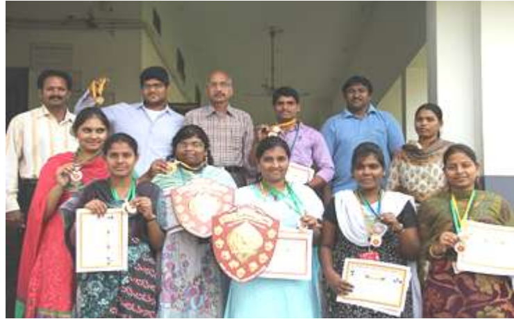
Sporting achievers sharing their moments of joy with Director

The following students bagged prizes in the various events JNTU-K Power lifting, Weight lifting and Body building championship at Chirala Engineering College, 31st Jan & 1st Feb'14.