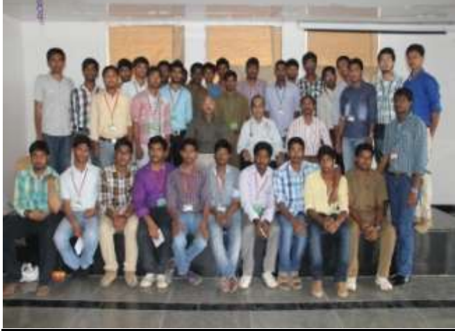
Making sense of Humanity: Students donating Drops of Life at the Blood Donation Camp