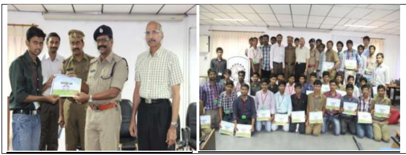
Deploying Youth& Technology in National Duty: Students posing with Director

➤ NSS Volunteers were deployed for webcasting the voting proceedings in MPTC & ZPTC elections held in 2 phases-6<sup>th</sup> & 11<sup>th</sup> April'14. The volunteers were awarded commendation certificates by the DSP, Nuzvid.