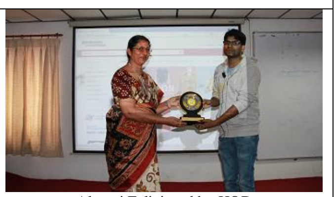
Alumni Felicitated by HOD