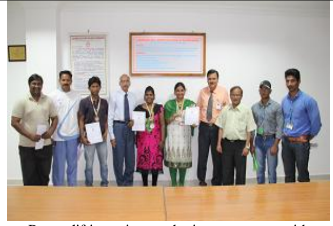
Power lifting winners sharing a moment with Director