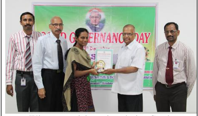
Winners receiving prizes during Good Governance Day