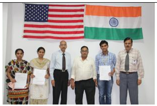
Chairman with MBA students placed in FACT SET