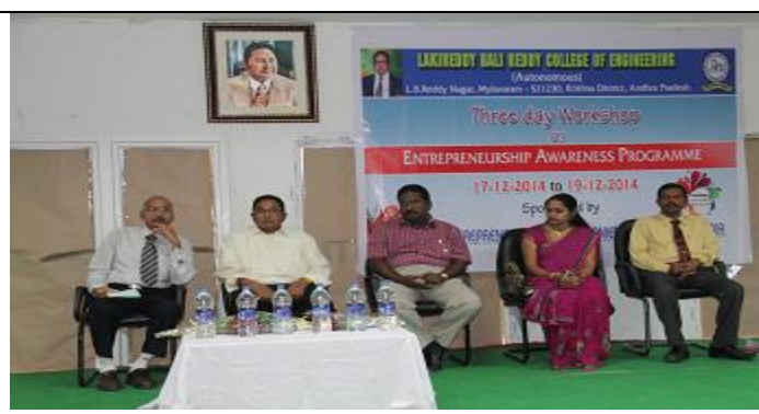
Still from the Inaugural of Workshop on Entrepreneurship