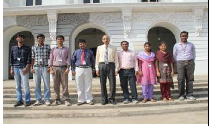
Director with students placed in Virtusa