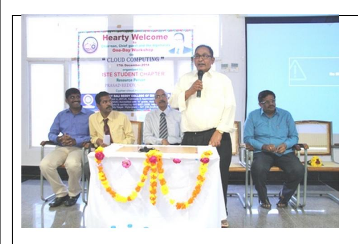
One-day workshop on "Cloud-Computing"