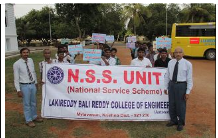
Sensitization rally on National AIDS Day, 1st Dec. '14.