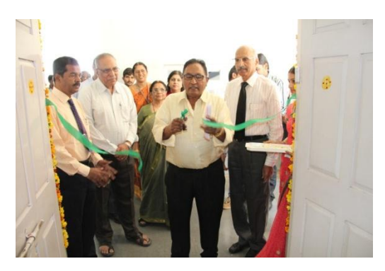
Building Technology for Future: "Robotics Club" Inauguration @ EEE Dept.

Chairman inaugurated the Center for Robotics on 4<sup>th</sup> December in EEE department.