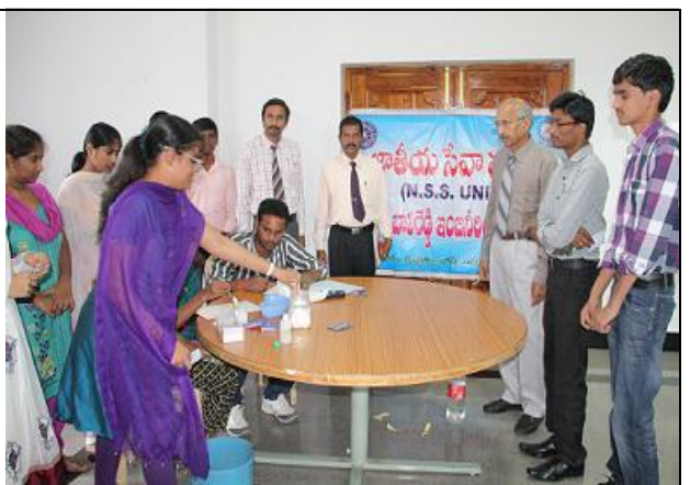
Blood Group check programme , in association with Red Cross Society, for 800 I B.Tech & PG students on 10<sup>th</sup> Dec.'14.