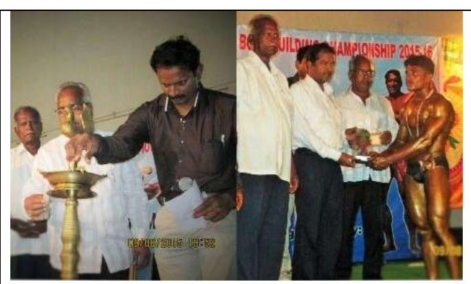
An action from Inaugural function