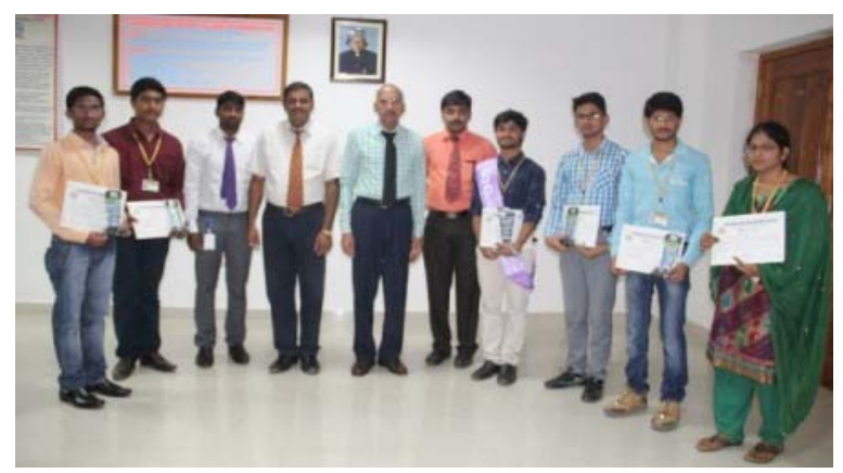
Prize winners posing with the Director

Bagged prizes in SPARTNS 2K15, a Two-Day National-level meet organized by the Department of Business and Management Studies at GEC, Gudlavalleru during 20<sup>th-</sup>21<sup>st</sup> Nov'15.