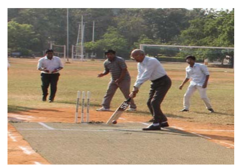
Striving for a healthy body & spirit

Annual Inter-Departmental Games for faculty, staff and students inaugurated by The Director on 13<sup>th</sup> Nov'15.