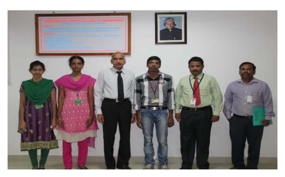
Achievers sharing their moments of joy with the Director & the Placement team

Osmosys Technologies, a major software company selects 03 students from the oncampus drive on 07 Jan'16. Department-wise break up: CSE -01, IT - 01 and ECE - 01