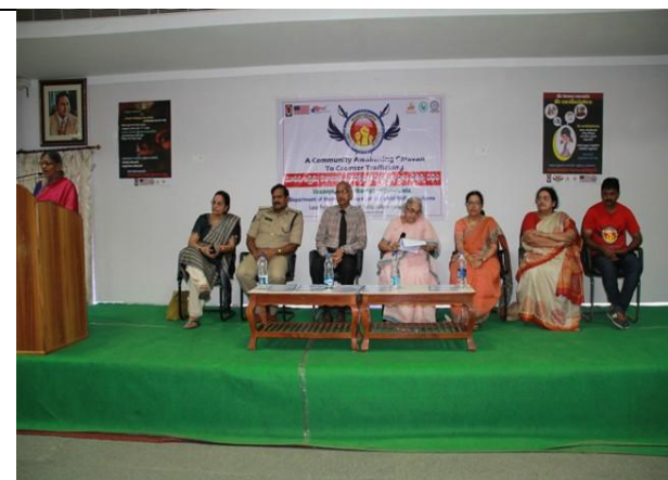
A cross section of intelligentsia sharing a common platform

Organized an awareness program on "A Community Awakening Caravan To Counter Trafficking" in association with AP Child & Women Welfare Dept., Govt. of AP, Prajwala Foundation ad Vasavya Mahila Mandali on 29 th Feb’16.