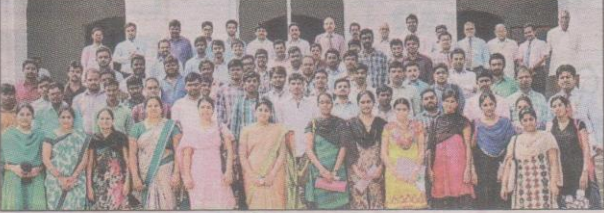
సమ్మేళనంలో పాల్గొన్న పూర్వవిద్యార్థులు