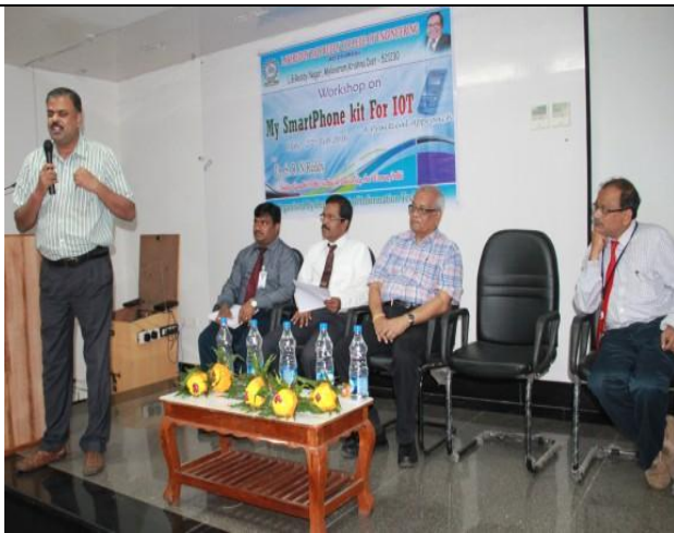
Resource Person making an observation during the inaugural