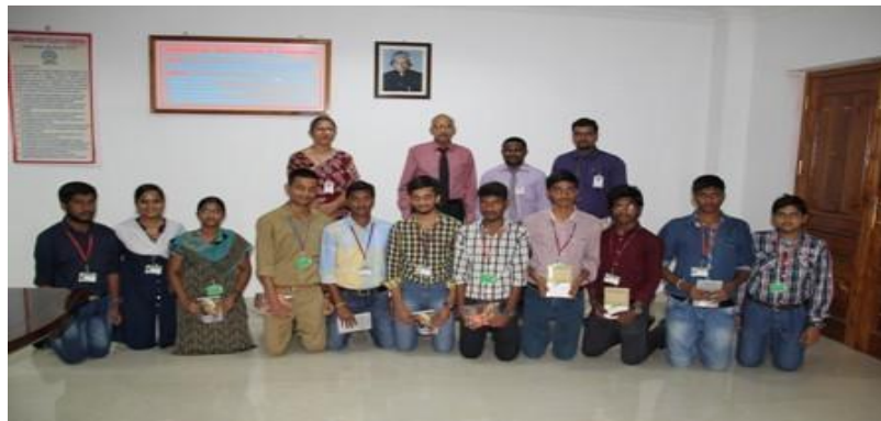
Achievers sharing their moments of glory with the Director