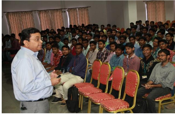
Industry veteran addressing the students