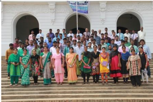
Reliving Happy times @ Alumni meet-2016