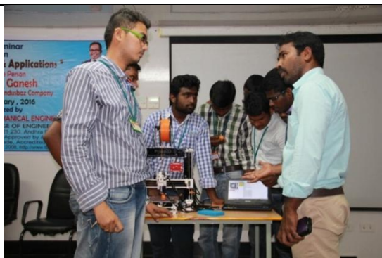
Real time experience @ seminar