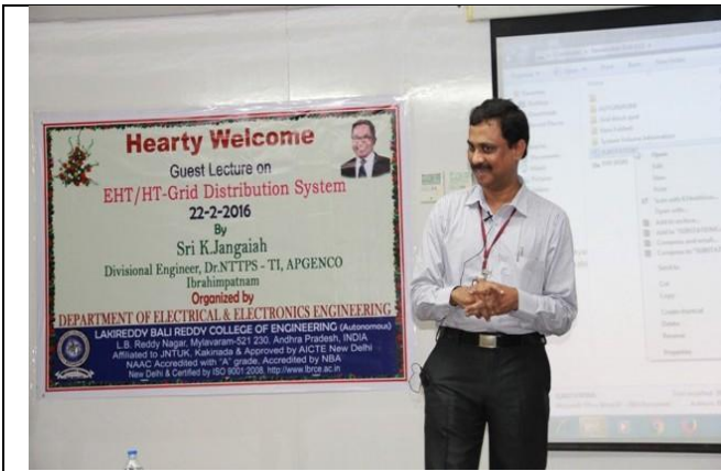
Resource person making a point @ Guest Lecture