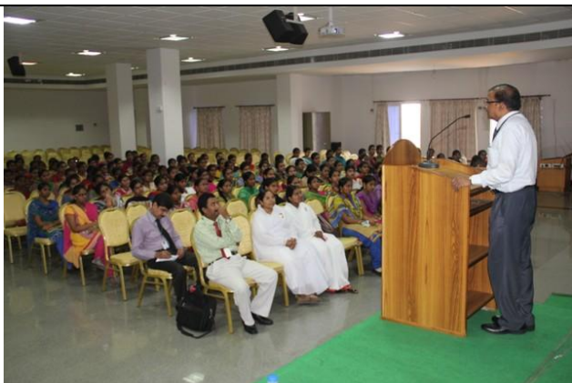
Resource person from TCS addressing students @ seminar