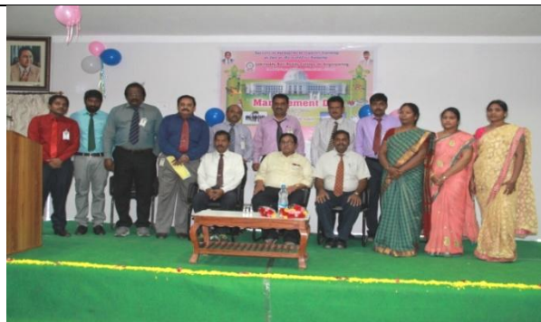
Hon’ble Chairman @ Management Day Fete

Conducted a programme on “Management Day-2016” under the auspices of the School of Management Studies on 20 th Feb’16. Apart from II & IV Sem MBA students and alumni of 2011-2013 batch participated in this programme.