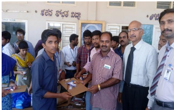
Distributing Exam kits