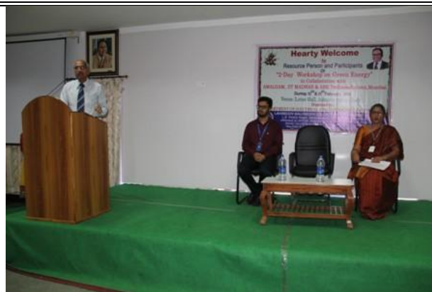
Director speaking @ Workshop on Green Energy