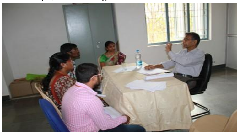
Students in rapt attention @ project review