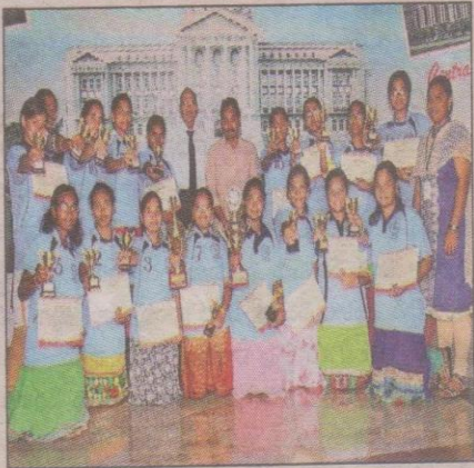
పతకాలు సాధించిన విద్యార్థులతో అధ్యక్షుడు, డైరెక్టర్