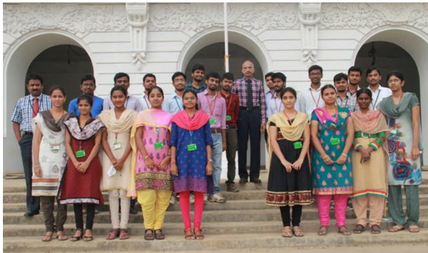
Achievers Sharing their joy with Director