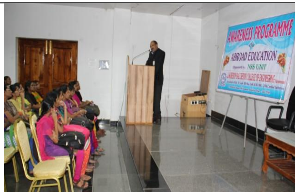
Action from the seminar on Abroad Education