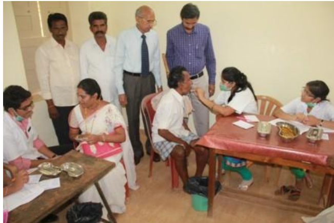
A snap @ Dental Checkup