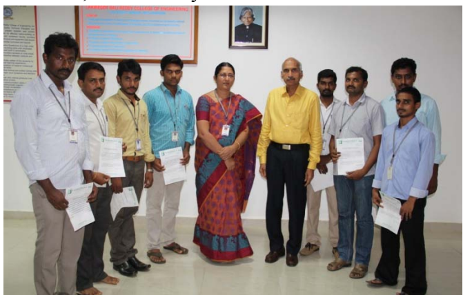
Trained NT personnel with the Director & HOD, EEE

➤ A Two-week Training Program at G.S.Electrical Ltd. , New Autonagar, Vijayawada attended by Technicians/Demonstrators, 16 - 28 May'16.