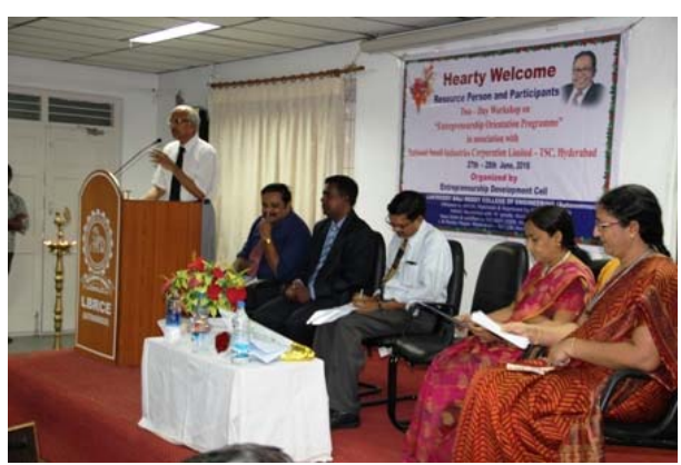
From the inaugural function @ EDC Programme...