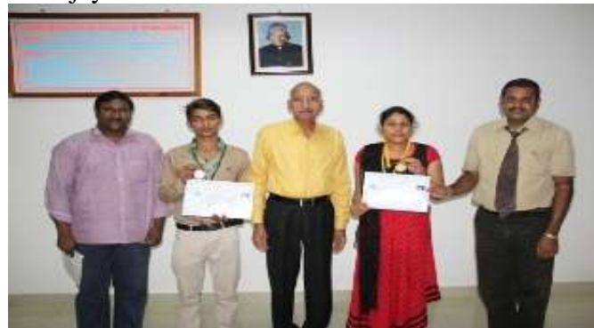
Winners in weightlifting championships sharing their moments of glory with Director & others