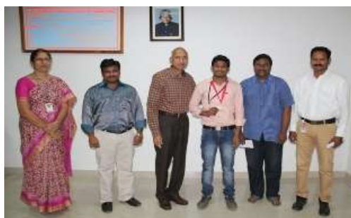
Weightlifting winner sharing their moments of glory with Director & others