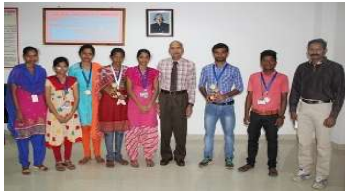
Sporting achievers posing with Director. Also seen is the Physical Director