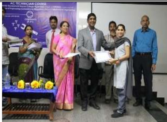
The Managing trustee presenting certificate to a participant