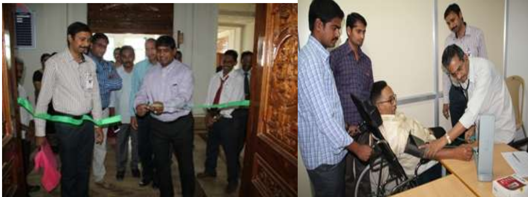
Managing trustee inaugurating Health camp; Chairman undergoing check up