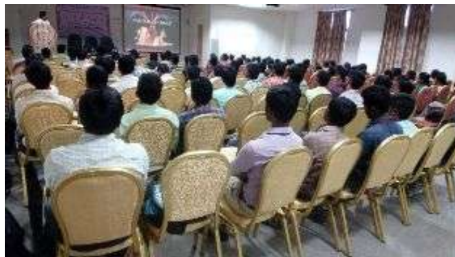
A view from the seminar on health awareness