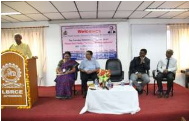
Director delivering his address @ FDP in EEE