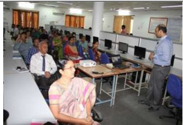
The resource person snapped in action @ FDP in EEE