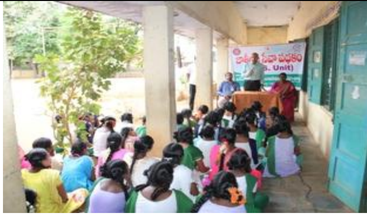
Awareness Program on “Examination System, Evaluation parameters For X Class Students”