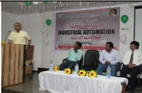
A snap from inaugural of workshop in EIE