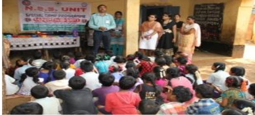
Awareness Program on “Improving literacy Campaign”