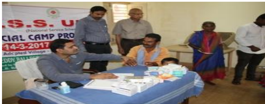
The Orthopaedic Camp in progress...