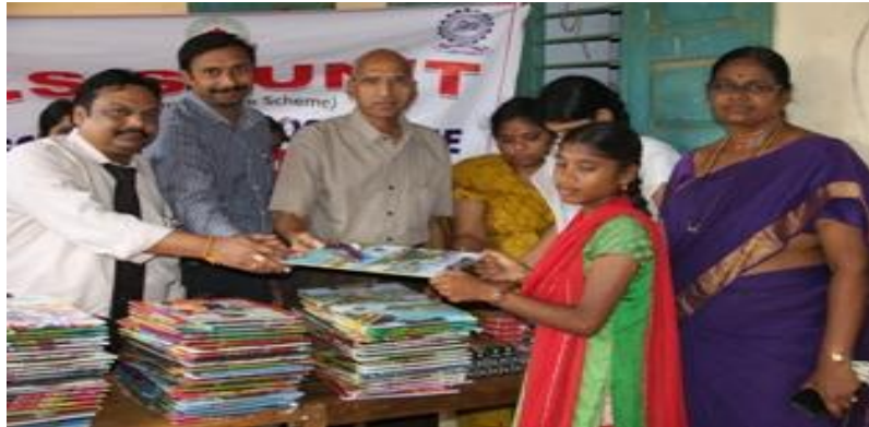
Distribution of Examination kit to X Class students