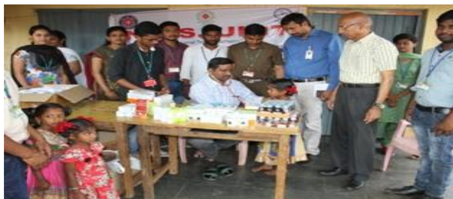
Paediatric Camp at MPUP School