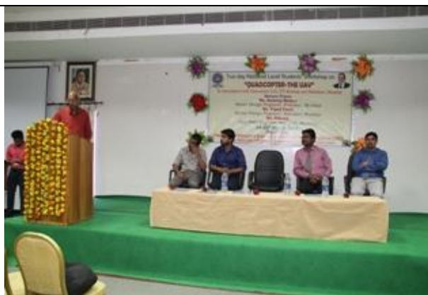
Director speaking @ Workshop in ME