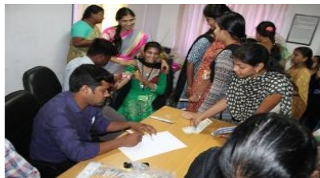
The awareness camp in progress...