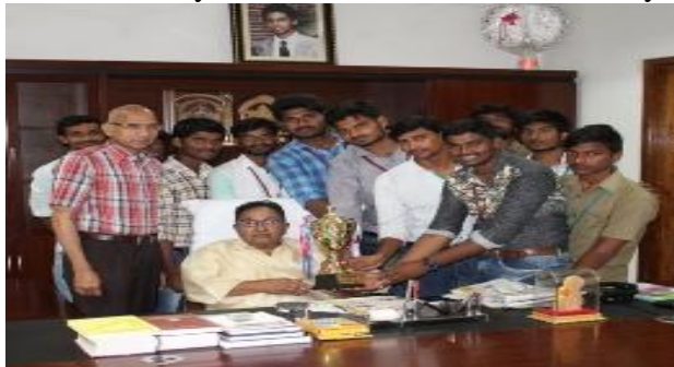
Jubilant Kabaddi team posing with the Chairman