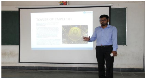
Workshop in Civil in progress...