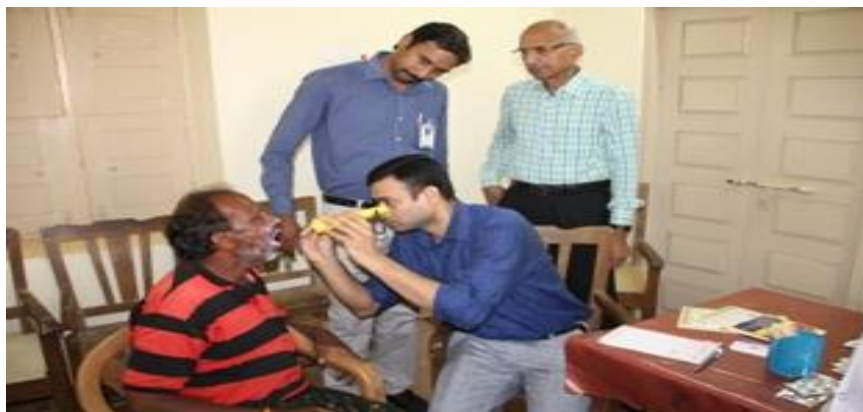
The Dental Camp in progress...as Director & NSS Program officer look on

The NSS Unit conducted a special camp at Pondugala village during 14th-20th Mar'17.