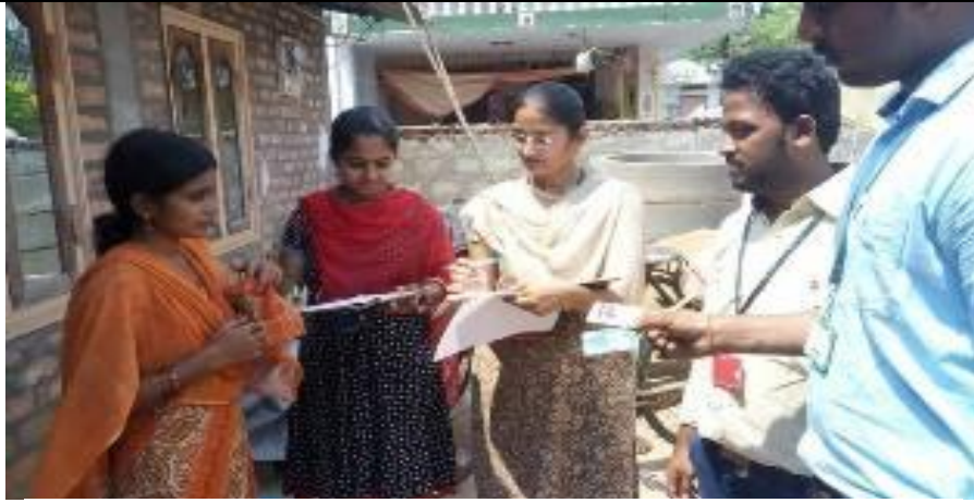
Awareness Program on “Cashless Transactions Demonetization”