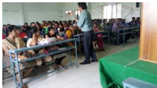
The resource person in action...