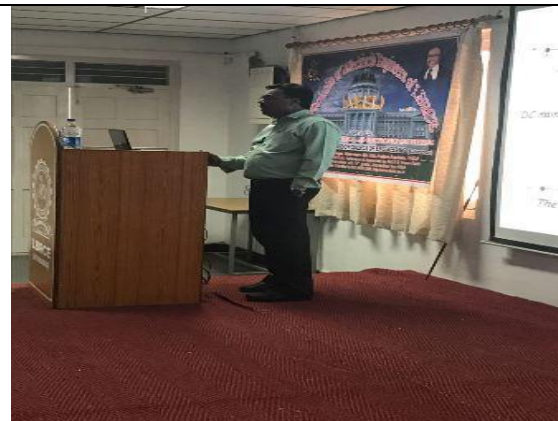
A view of the Gest Lecture @ EEE