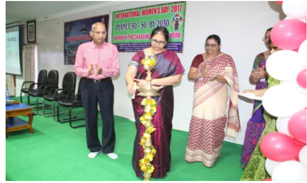
A snap of the inaugural @ Int'l Womens Day