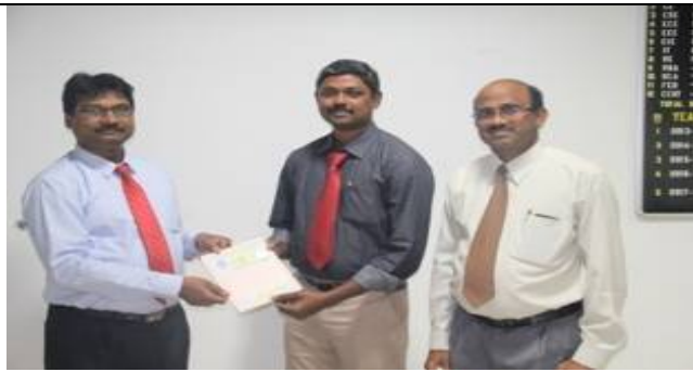
The Doctorate awardee posing with Principal and Vice principal