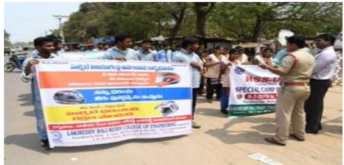
The rally on Road safety in progress...