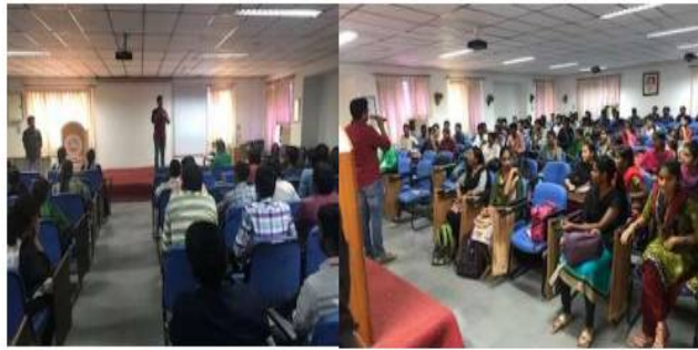
A view from the Career guidance session in EEE