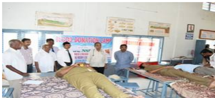
The vice chairman inspecting the Blood Donation Camp