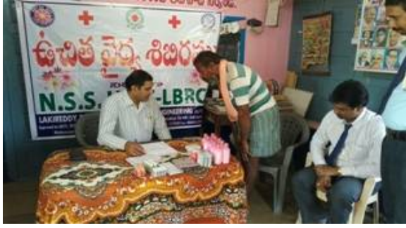
Ortho camp in progress...