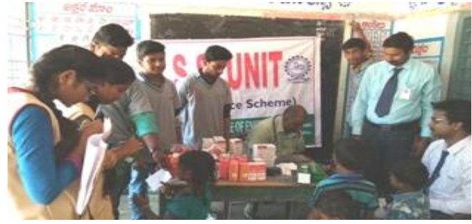
A Snap from the Pediatric camp