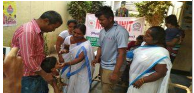
Volunteers helping personnel @ Pulse polio program