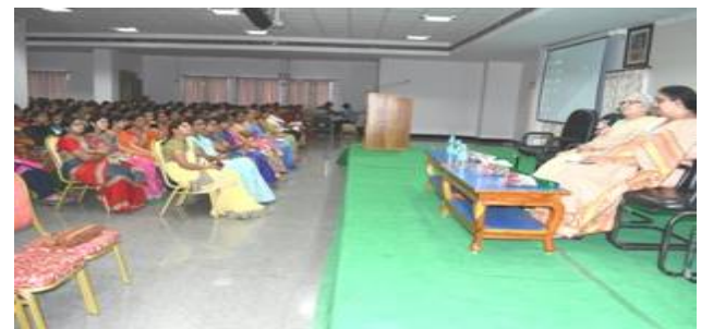
A view from the Women’s Day function