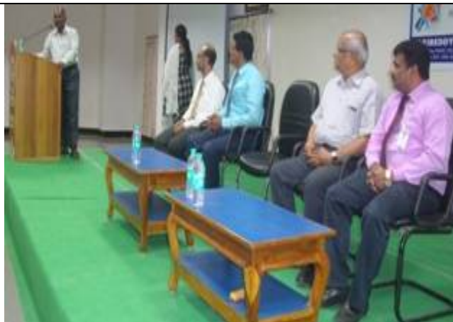
A snapshot of the inaugural @ CSI Guest Lecture