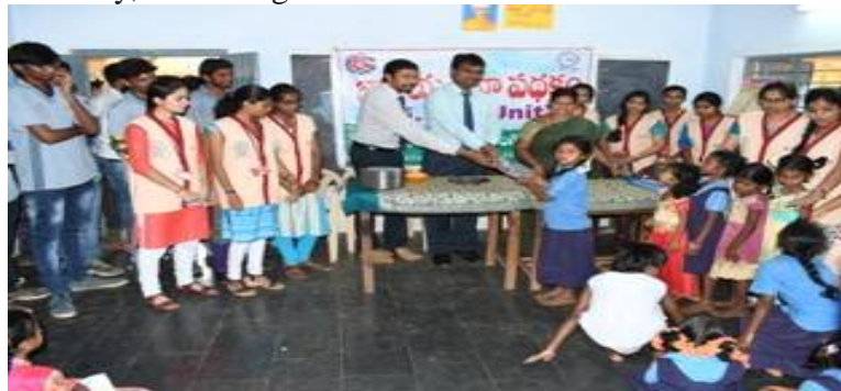
Principal distributing Dining plates to school children