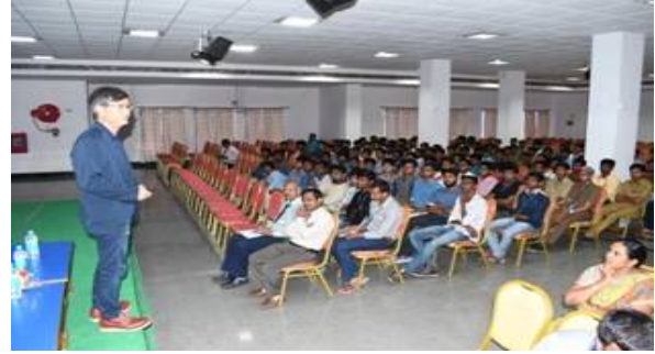
The Visiting Professor from Japan interacting with students