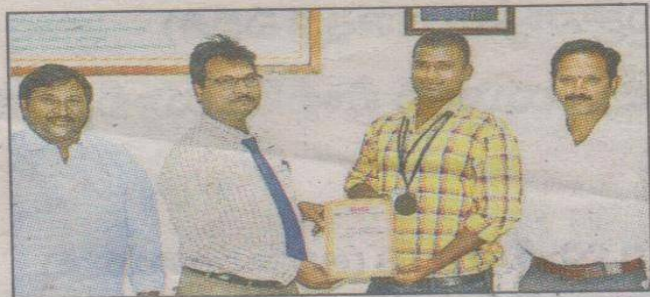
విద్యార్థిని అభినందిస్తున్న ప్రిన్సిపల్ అప్పారావు