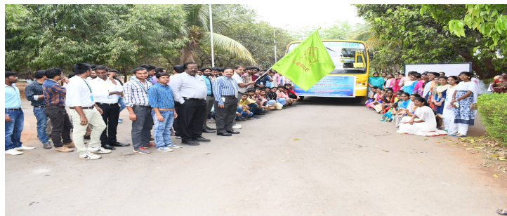
A view of the industrial visit by MBA students