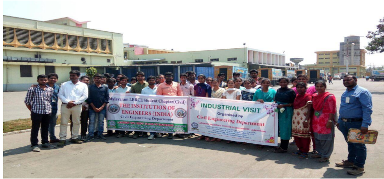
Civil Engg students snapped during industrial visit

➤ B.Tech III Yr. students of Civil Engineering visited the Milk Project at Vijayawada on 16 th Mar' 18.