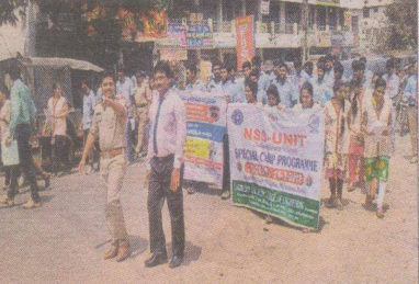
ర్యాలీ నిర్వహిస్తున్న విద్యార్థులు