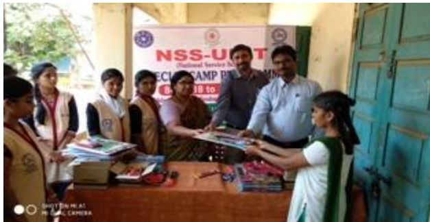
Distribution of Exam Kits to Exam-bound students