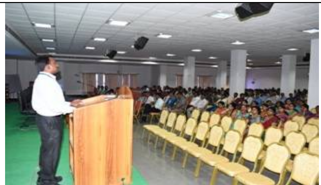
The Bank official addressing faculty and staff