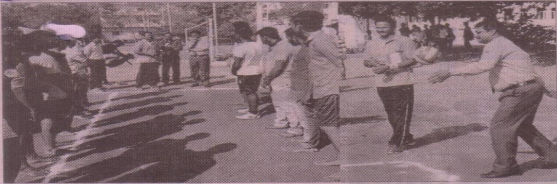
క్రీడాపోటీలను ప్రారంభిస్తున్న ప్రిన్సిపాల్