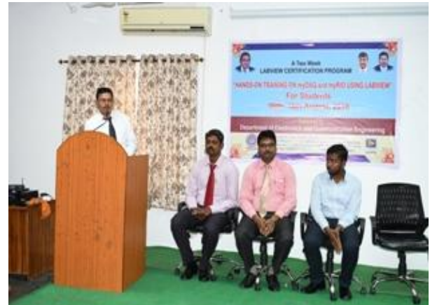
A view of the inaugural @ workshop on LABVIEW