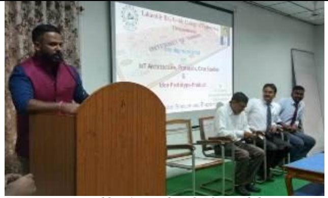
Resource person addressing students@ IOT workshop