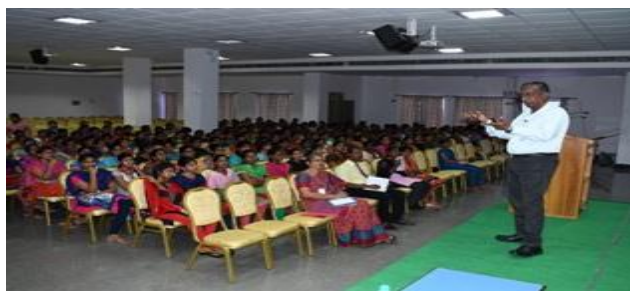
Participants in rapt attention @ IEEE program