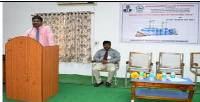
Principal delivering inaugural address@ workshop for NT