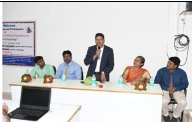
Vice chairman speaking @ the inaugural of Python workshop