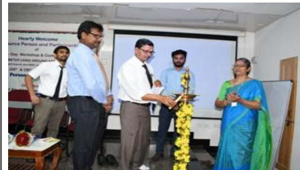
Vice chairman inaugurating the workshop in EEE