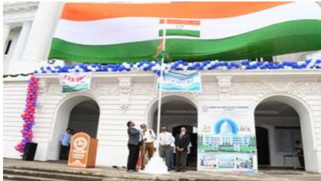
Co-chairman unfurling the Tricolor