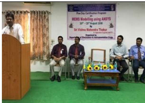
Principal delivering inaugural address@ MEMS workshop