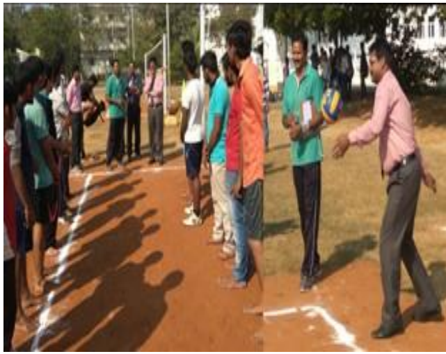
Principal encouraging students as physical director looks on