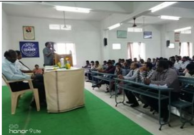
A view from the awareness program in MBA