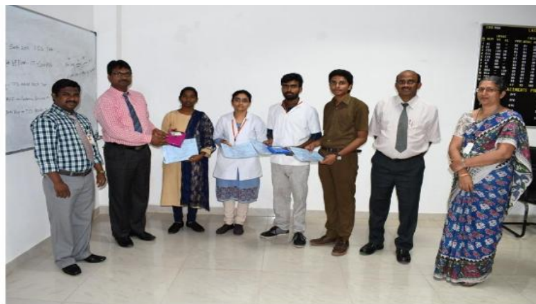
Prize Distribution by Principal