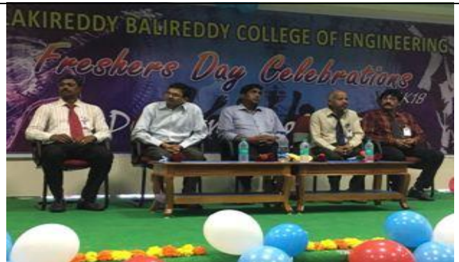
Dignitaries snapped @ the inaugural of Fresher's Day