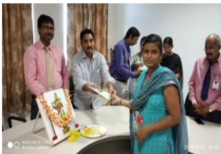
President presenting prize @ Telugu Basha Dinostavam