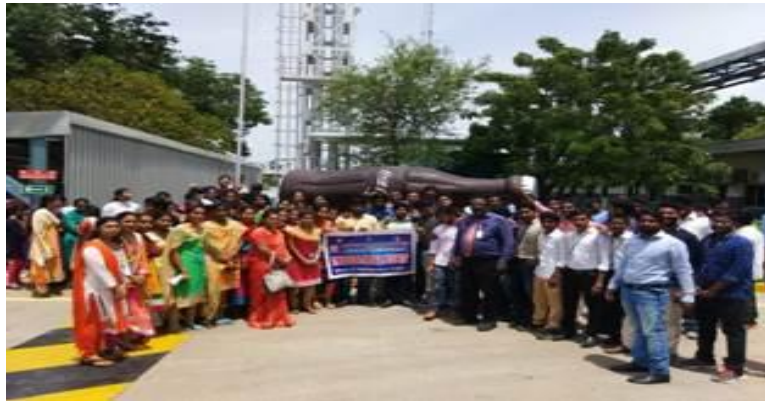
A view of the industrial visit by MBA students