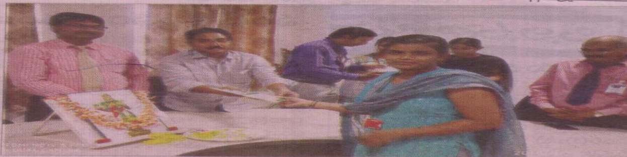
విజేతలకు బహుమతులందిస్తున్న దృశ్యం

జాతీయ క్రీడా దినోత్సవంగా ప్రభుత్వం ప్రకటించిందని పేర్కొన్నారు. మేజర్ ధ్యాన్ చంద్ హాకీ క్రీడ ద్వారా దేశానికి అందించిన ఘన విజయాలను వివరించారు. ఆయనను విద్యార్థులు స్పూర్తిగా తీసుకొని భారత దేశ ఖ్యాతిని ప్రపంచానికి చాటి చెప్పాలని కోరారు. ఈసందర్భంగా స్టూడెంట్స్ వాలీబాల్ పోటీలను ప్రారంభించారు.