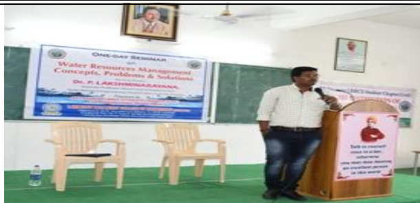
Professor from Ethiopian university @ seminar