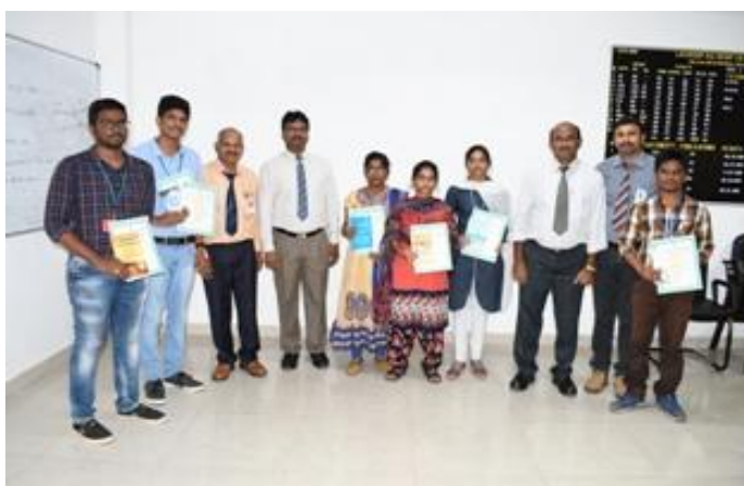
Prize winners posing with Principal & others