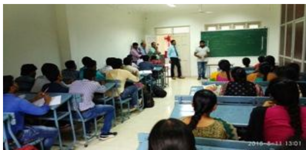
The seminar in MCA in progress...