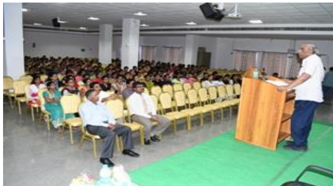
APSSDC Director addressing students