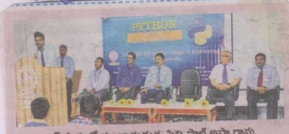
వర్క్ షాపులో మాట్లాడుతున్న ప్రెస్సిపాల్ అప్పారావు