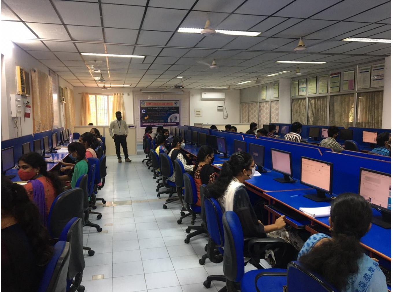
Glimpse of Event on Day -1