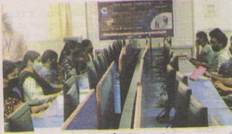
శిక్షణ తరగతుల్లో పాల్గొన్న విద్యార్థులు