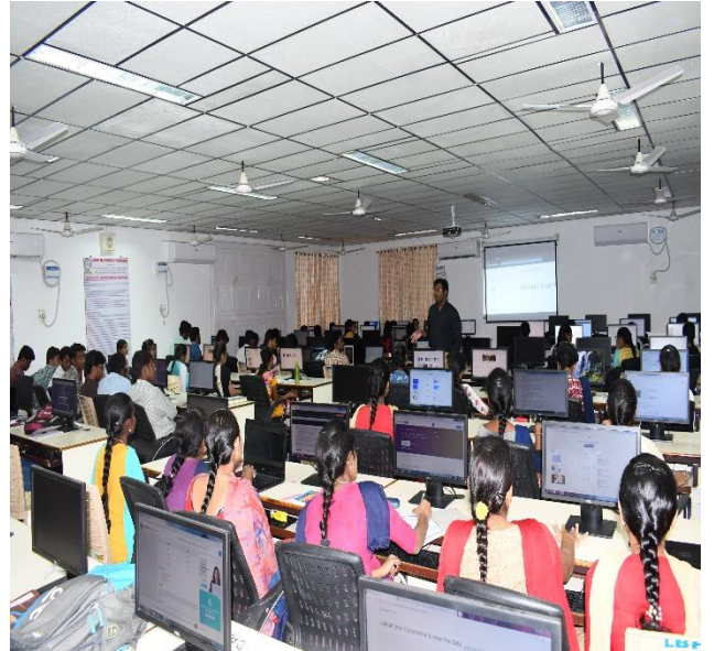
A Glimpse of training session