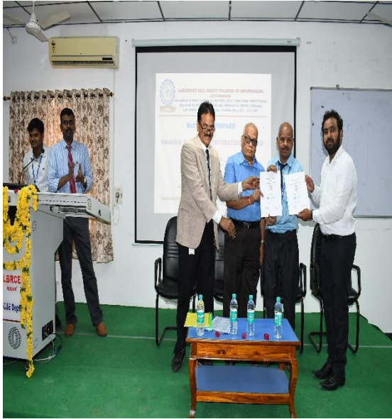
MoU Exchange between Devspark and LBRCE for establishing an Incubation Center in the campus