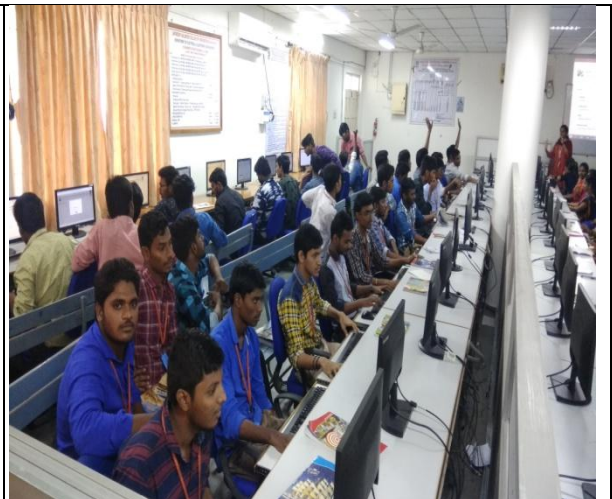
Students practising on Python