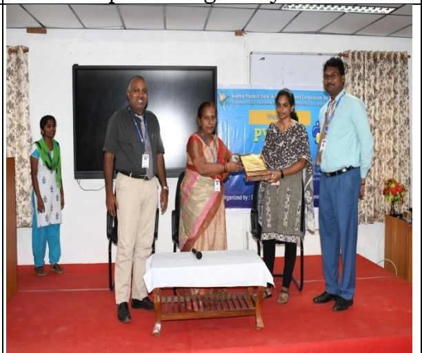
Felicitation of the Resource Person by HOD & Co-Ordinator-EEE