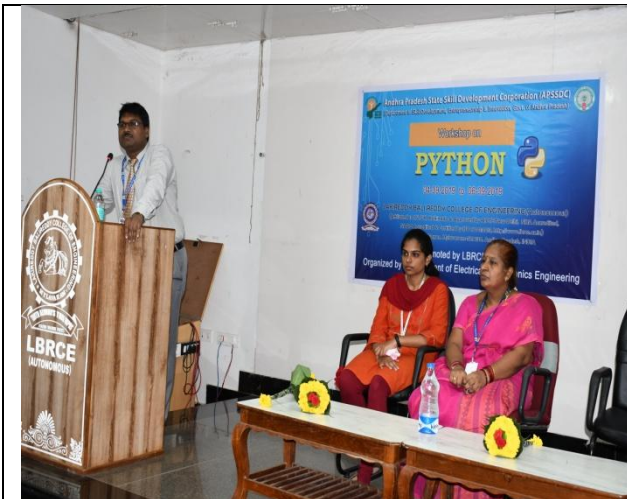
Addressing by Principal